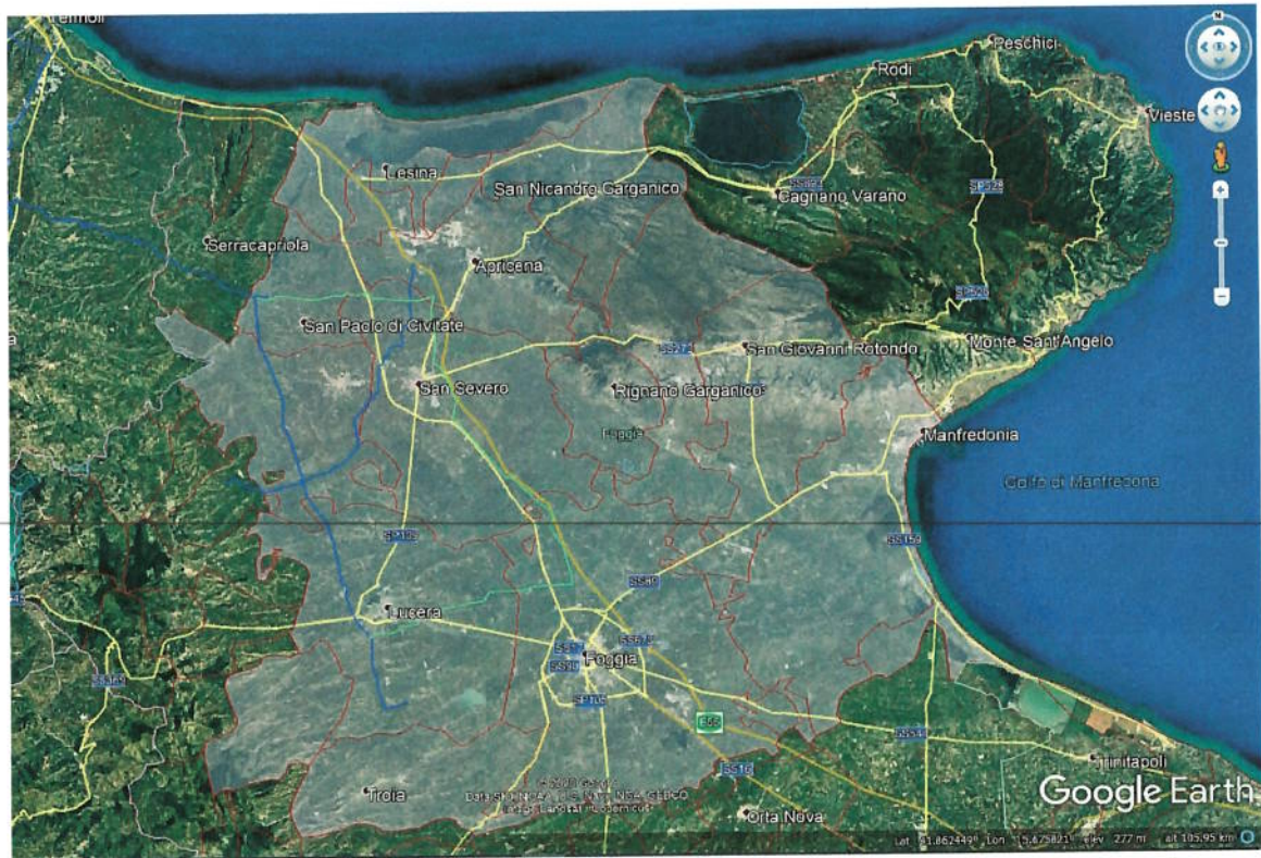
Figura 2 - Area specifica di intervento