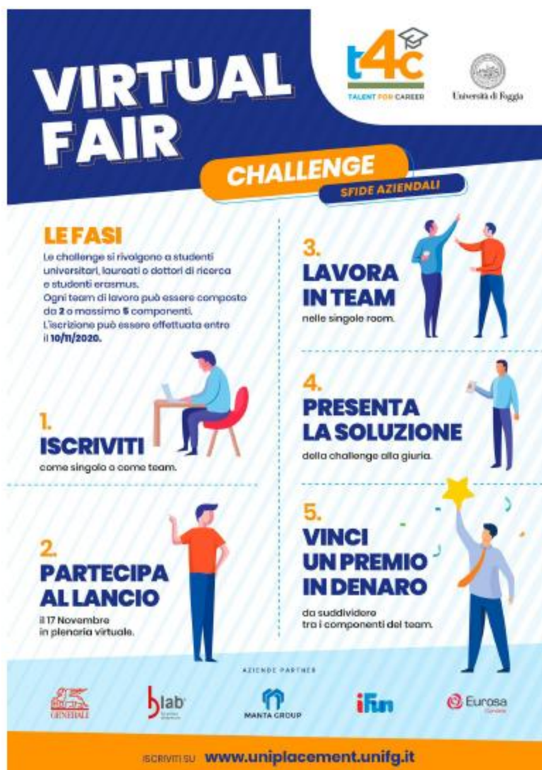
Figura 3 – Locandina della Challenge