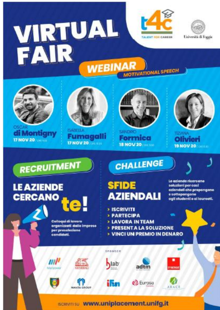
Figura 3 – Locandina della virtual fair

Tiziana Olivieri 19 (Novembre 2020), Industry Executive Director Western Europe di Microsoft.