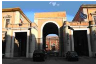
Via Romolo Caggese