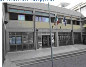
Sede di San Severo