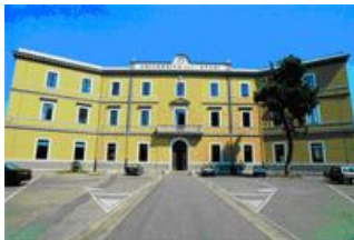
Largo Giovanni Paolo II

La Facoltà di Economia di Foggia è organizzata per offrire servizi innovativi e personalizzati per rispondere alla domanda di formazione e ricerca scientifica che proviene dal sistema economico-sociale e territoriale volta all'innovazione tecnologica e all'internazionalizzazione.