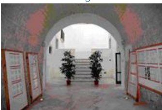
Sede di Manfredonia